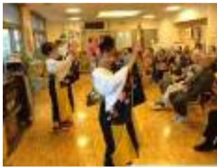
素晴らしい 舞踊を 楽しみました